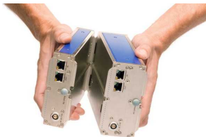
imc Klick Mechanismus

Das so gebildete Mess-System wiederum ist über eine gewöhnliche Ethernet Verbindung (LAN / WLAN) mit einem PC zu steuern, der als Konfigurator und Messdatensenke fungiert.