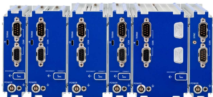
Rückseite des Blocks: CAN, Versorgung, Terminator, Verriegelungsschieber