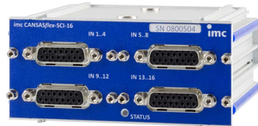
imc CANSASflex-SC16 (Abb. ähnlich)

Modulausführungen mit DSUB-15 Anschlusstechnik unterstützen alle Messmodi. Varianten mit alternativer Anschlusstechnik wie z.B. Thermobuchsen dagegen nur ausgewählte Messmodi wie Thermoelement.