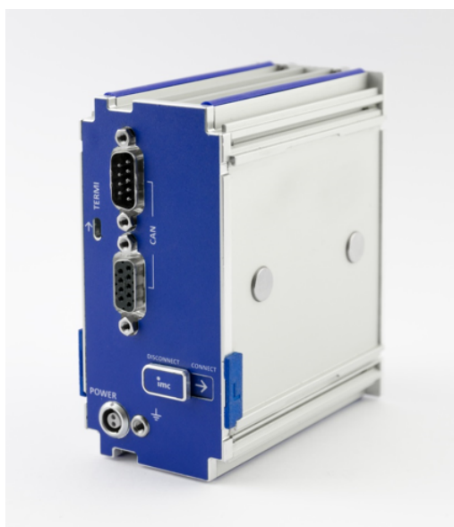
linke Schutzkappe (gekennzeichnet mit "L")