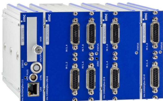
imc CANSASflex Module als Block (Klick-Verbindung) mit imc BUSDAQflex Logger (links)