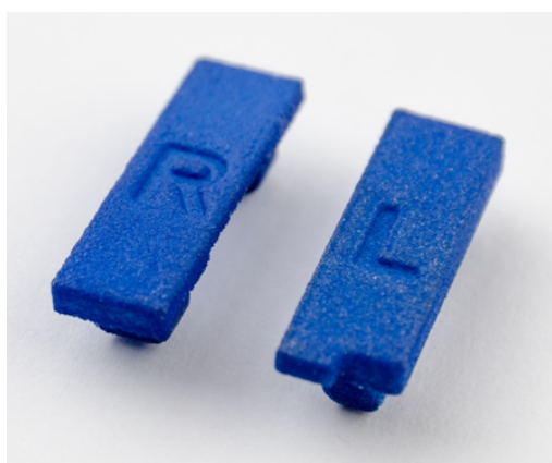
Set bestehend aus linker und rechter Schutzkappe