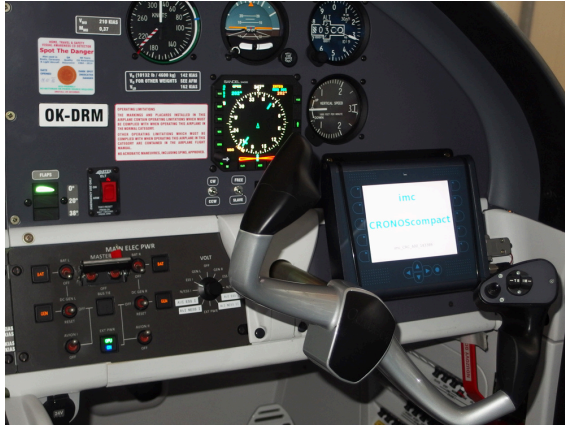
Abbildung 4.

Für sichere Tests sorgen die Black-Box Funktionalität, die stabile Spannungsversorgung des imc-Systems dank integrierter USV sowie die redundante, konfigurierbare Mess- datenspeicherung (intern und extern).