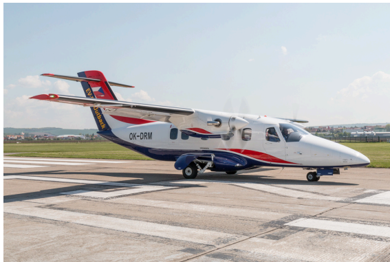
Abbildung 1. EV-55 Outback – bei Festigkeitstests wird imc-Messtechnik eingesetzt

Die Testabteilung von Evector setzt bei Festigkeitsprüfungen für die Zertifizierung dieses neuen Flugzeugtyps auf Messtechnik von imc.