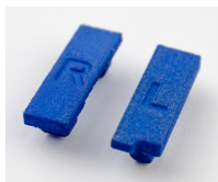
CANFX/COVER-IP40: Set bestehend aus linker und rechter Schutzkappe