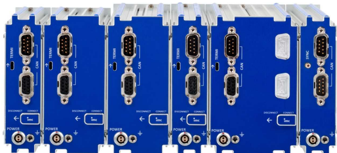
Rückseite des Blocks: CAN, Versorgung, Terminator, Verriegelungsschieber